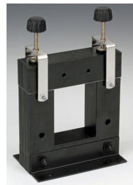
U kern 459700